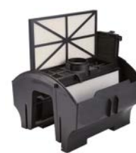
Accès au panneau filtrant par le dessus. Entretien facile. Le panneau filtrant est facile à enlever, facile à nettoyer et facile à remettre RCX70101PAK2 (inclus).