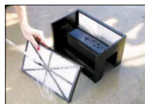
Panneaux filtrants faciles à enlever, à nettoyer et à remettre