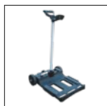
Caddy inclus Le chariot permet de déplacer et de stocker le robot rapidement et en toute simplicité.